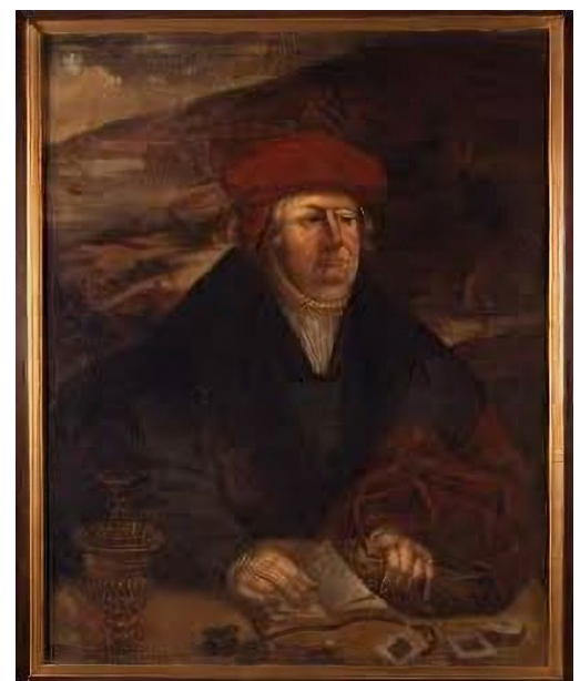
Focco Ukena van Brokum hōuetling to Edermoer end Liier. Her van Aurich end Brockmerland offte Brocum.