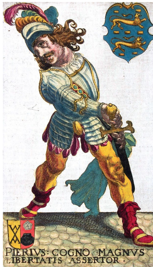
Illustratie in een boek uit 1622 van hoe Grote Pier eruit kan hebben gezien. Pier draagt hier echter een 17e-eeuws, in plaats van een 16e-eeuws kostuum. Let op de kullezak, die de mannelijkheid symboliseert. (Leeuwarden, Fries Museum)

Een braguette (ook codpiece, schaambuidel, schaamkap, kulzak of kullezak) is een kap, zak of buidel die de schaamstreek van de man bedekt. Men droeg het in de 15e en 16e eeuw tussen de hosen (losse broekspijpen) en het was daaraan met knopen bevestigd. Het werd in de 16de eeuw een symbool van viriliteit en kreeg steeds grotere afmetingen; men borg er geld, zakdoeken en zelfs versnaperingen in. Aan het einde van de 16e eeuw kwam de culotte in zwang (een kniebroek die aan beide zijden met knopen dicht werd gemaakt) en verdween de braguette uit de mode.