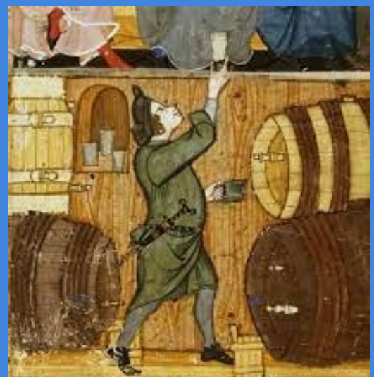
Bierbrouwer in de late middeleeuwen