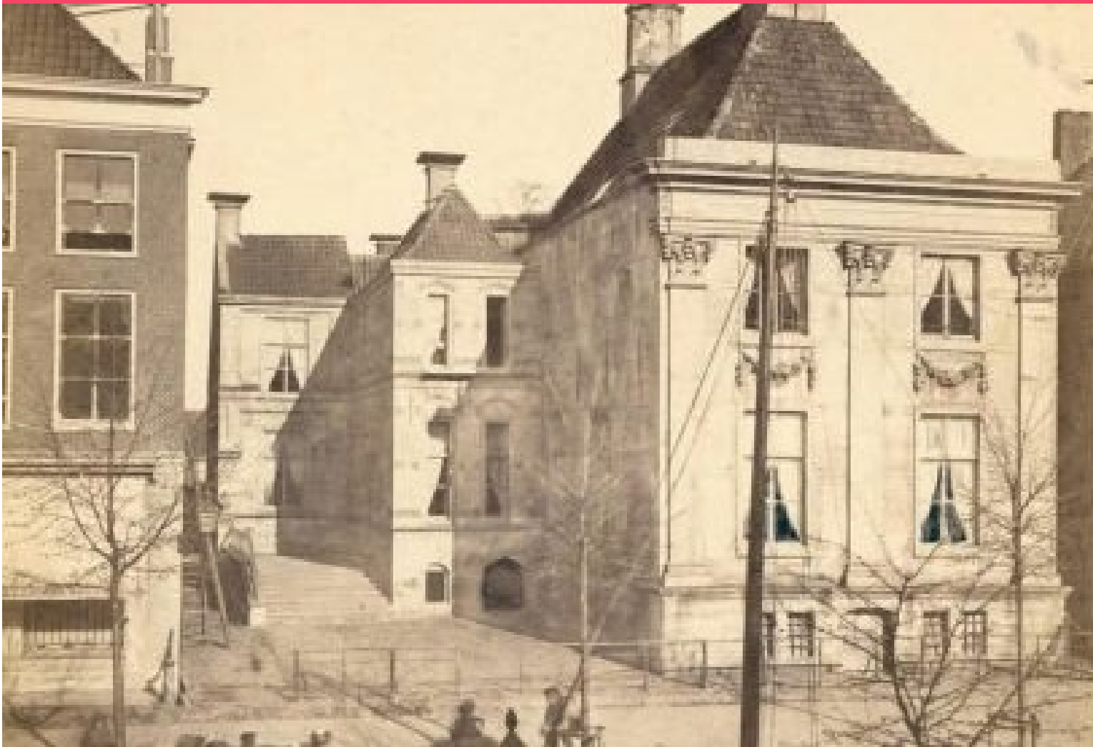
Amelanderhuis te Leeuwarden