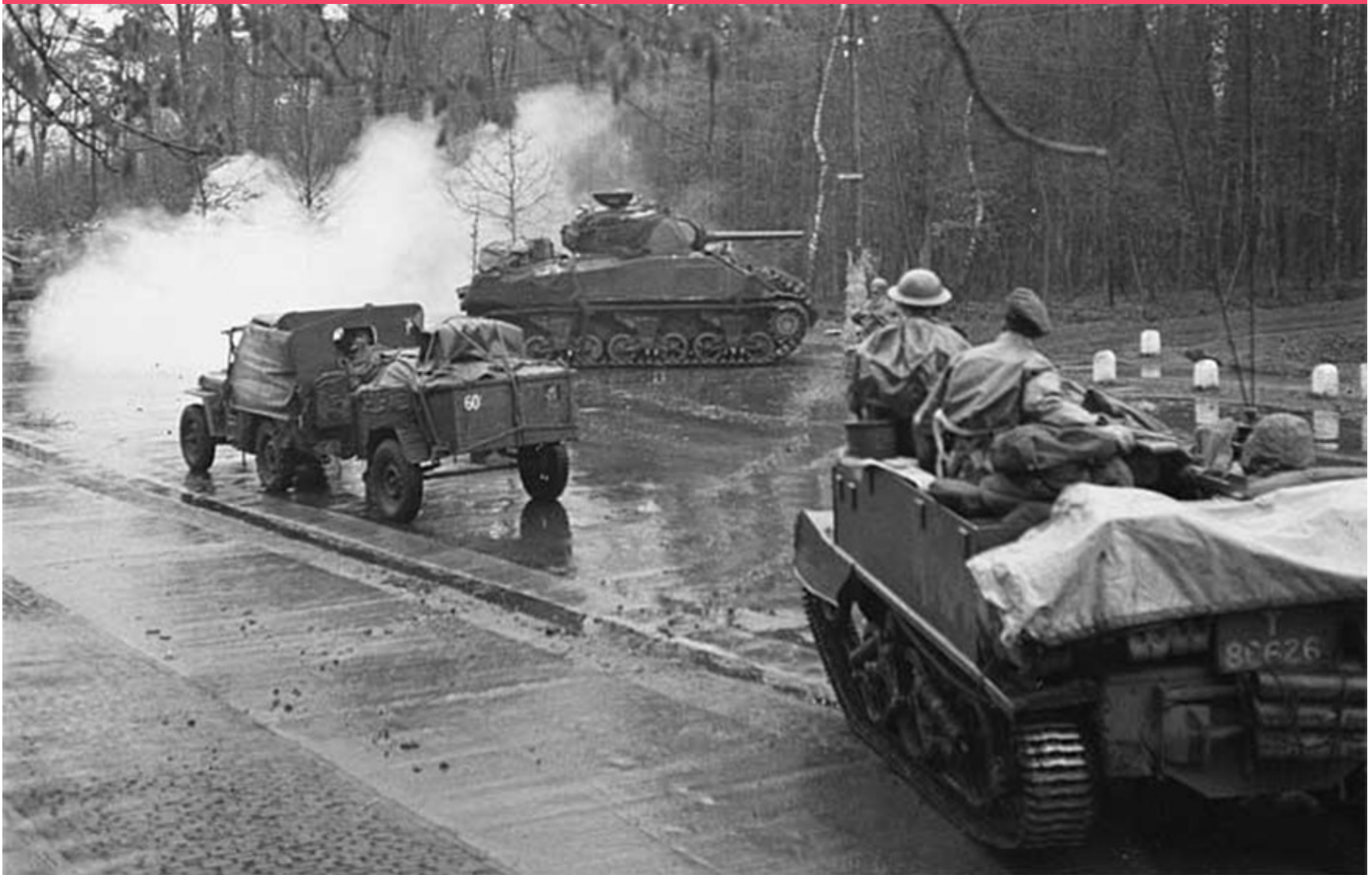
De Sherwood Rangers Yeomanry rukken op bij de Broeierd aan de Hengelosestraat in Enschede. De tank rijdt de Bosweg in, richting Hengelo.