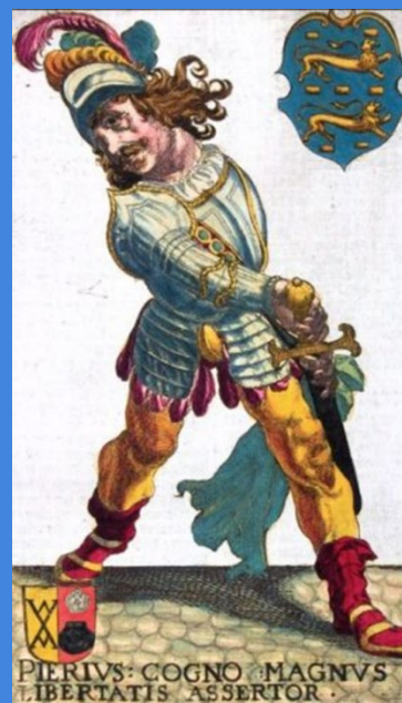
Prent van Grutte Pier (ca. 1480-1520) in een zeventiende-eeuws boek

Pier overleed, op ongeveer 40 jarige leeftijd op 28 oktober 1520 in Sneek, hij ligt daar begraven in de Martinekerk