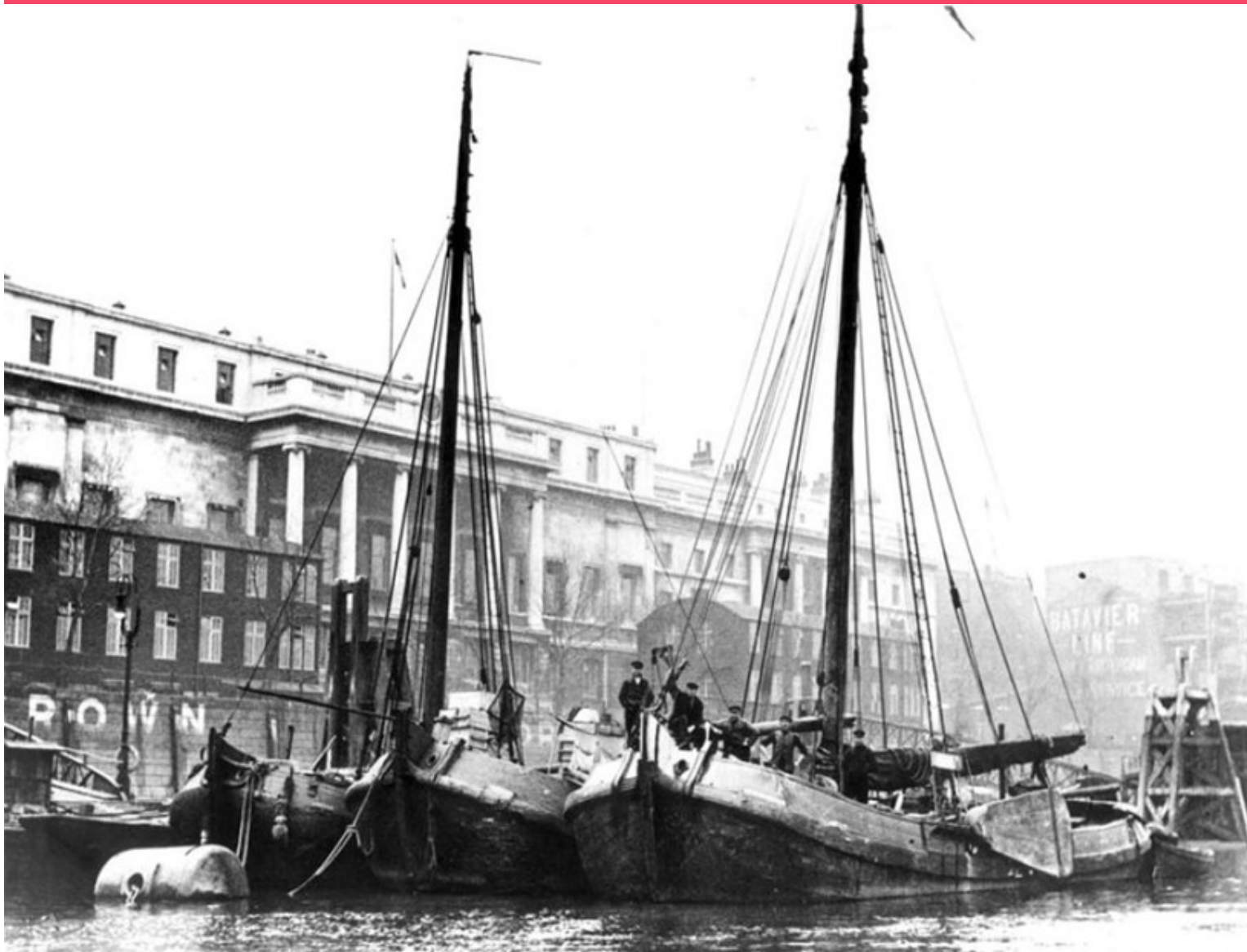
Palingaken in London (Billingsgate)