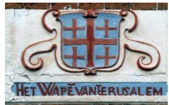
Een gevelsteen in Leeuwarden (Grote Kerkstraat 69) herinnert ook aan een reis naar het Heilige Land.

Bron: Friese testamenten tot [= vóór] 1550, Leeuwarden 1994, nr. 92, blz. 175-181.