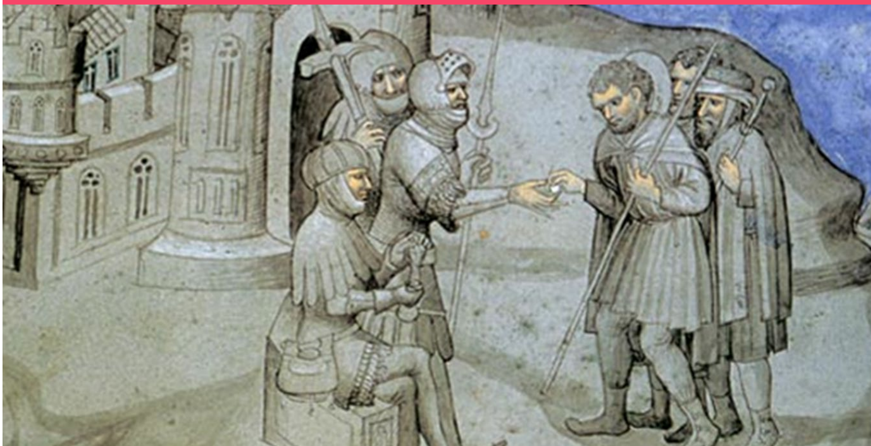
Afbeelding: Pelgrims moeten bij een toegangspoort in Jeruzalem tol betalen.