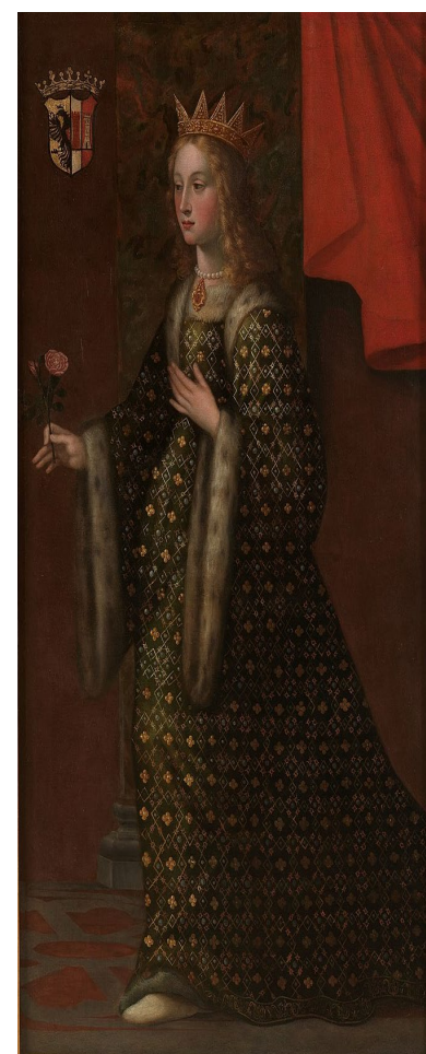
Historisch schilderij van Adelheid van Susa, olieverf op doek, 117 bij 202 cm, maker onbekend.

Adelheid stierf in december 1091. Ze werd begraven in de parochiekerk van Canischio (Canisculum), een klein dorpje aan de Cuorgnè in de Valle dell'Orco, waar ze in haar laatste jaren met pensioen was gegaan. In de kathedraal van Susa staat een notenhouten beeld in een muurnis. toont Adelheid knielend in gebed, met de inscriptie eronder: "Questa è Adelaide, cui l'istessa Roma Cole, E primo d'Ausonia Onor la Noma"