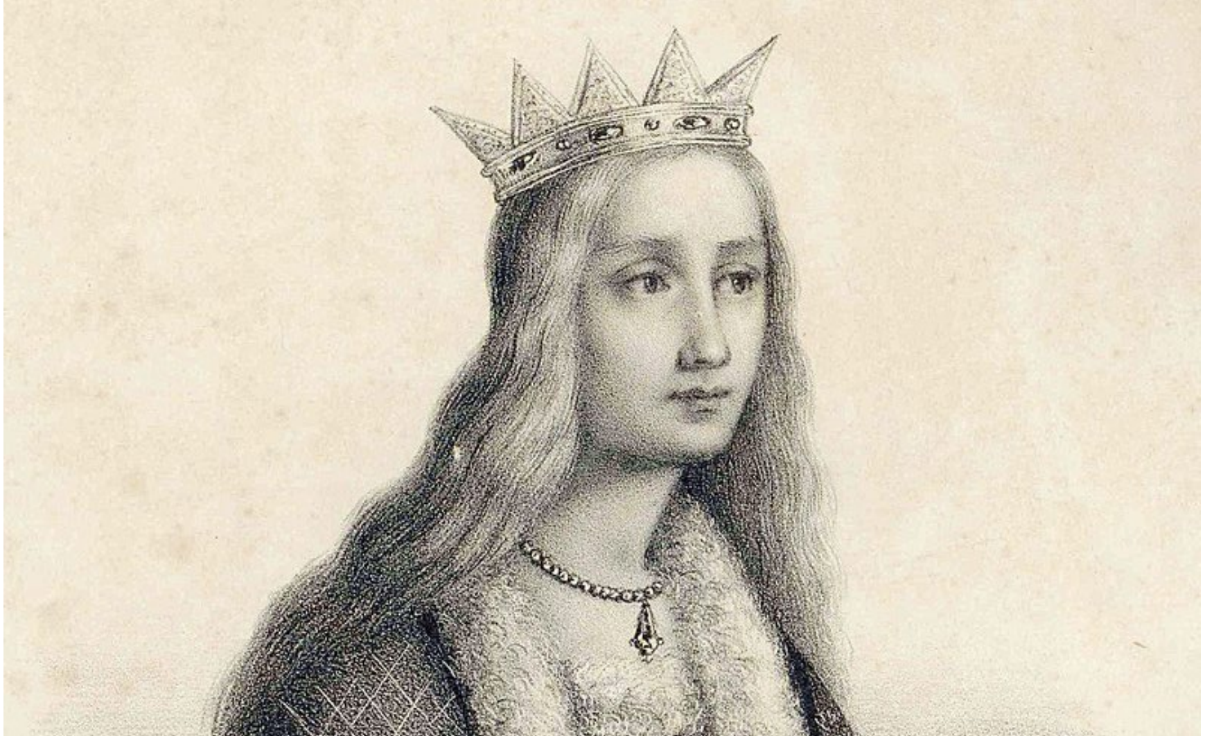
Adelaida Contessa di Susa